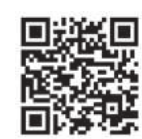
Garantiebedingungen und weitere Informationen: https://mb4.me/reifen-kompletttradschutz